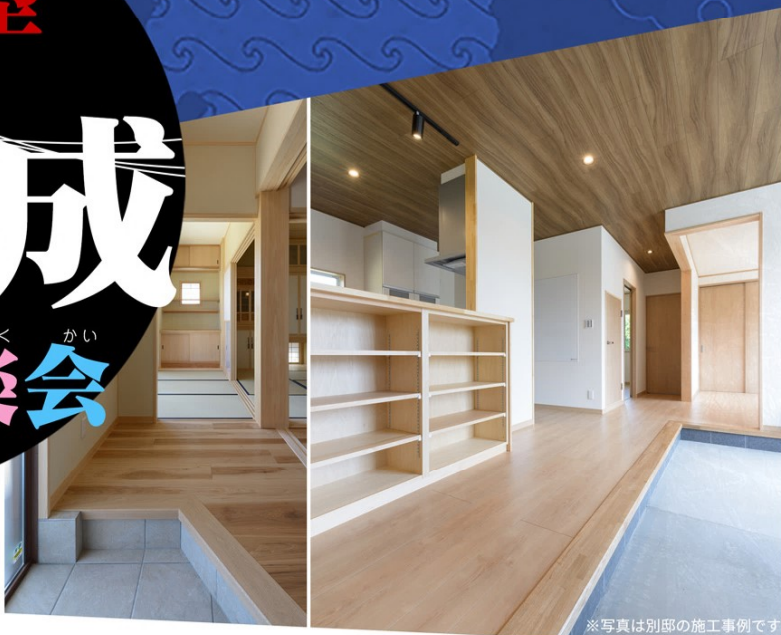
※写真は別部の施工事例です